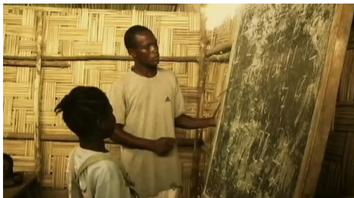
Imagem coletada do documentário “Escola de Bambu”

A campanha proposta por Vinícius Zanotti e seus apoiadores, busca instigar o apelo pela colaboração em forma de mobilização, na humanização dos personagens midiaticizados através de recursos midiáticos. A primeira ação projetada pelo nosso objeto de pesquisa foi o documentário “Escola de Bambu”. O vídeo foi gravado em 2010, ele é um curta-metragem de quinze minutos realizado por Vinícius, no qual aborda as dificuldades enfrentadas pelos liberianos, na busca por uma educação melhor para as mais de trezentas crianças da escola do país africano.